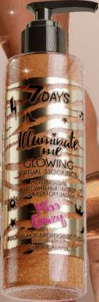
04 HOT CARAMEL